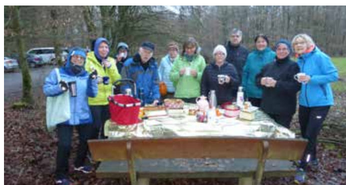
Am Jahresanfang schmecken der Samstagsgruppe die Reste an Weihnachtsplätzchen und wärmerer Tee im Kirschenwäldchen