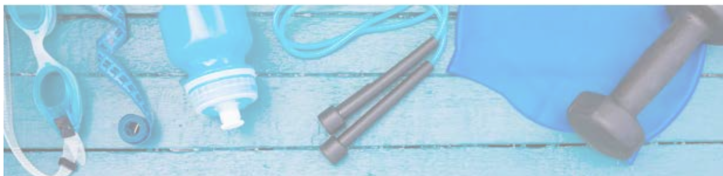
Vereinsrekorde TV Wetzlar 1847 Männer

Somit ließ sich die Zeit ohne Wassertraining in Wetzlar doch recht gut überbrücken, und ich freue mich, wenn wir wieder zur Normalität übergehen.