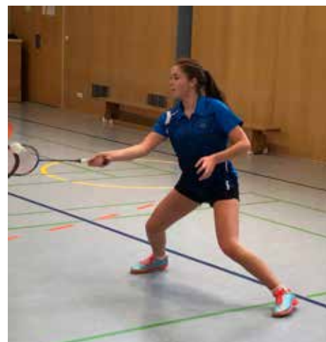
Erstes Training nach der Pause

um den angestrebten Aufstieg in die Hessenliga bangen. Auch die vierte Mannschaft des „BLZ“ konnte nicht mehr weiter um den Aufstieg von der Bezirksliga A in die Bezirksoberliga spielen. Nicht zuletzt musste die erste Mannschaft den Abstieg aus der Oberliga, der vierthöchsten deutschen Liga, fürchten.