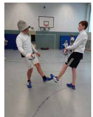
Fußgruß nach dem Gefecht

Am 11. Juni erfolgten schließlich weitere Lockerungen: es durfte auch wieder gegeneinander gefochten werden. Nach mehreren Wochen „nur“ Technik-Training freute sich jeder mal wieder auf ein „richtiges“ Gefecht. Nur das Abgrüßen - normalerweise per Handschlag - entfällt vorerst. Inzwischen hat sich in Fechterkreisen der „Fußgruß“ etabliert!