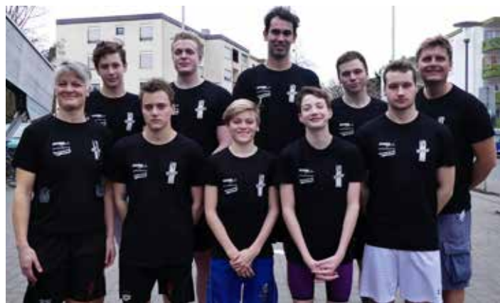
Das 2. Landesliga-Herrenteam.