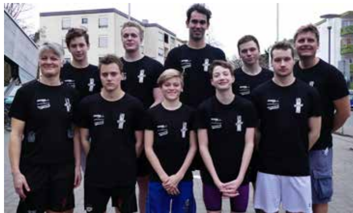
Das 2. Landesliga-Herrenteam.