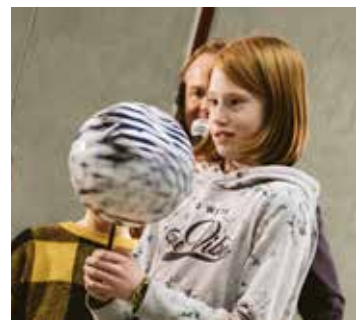
Auch der TV Wetzlar Nachwuchs versuchte sich an der Ball-Akrobatik