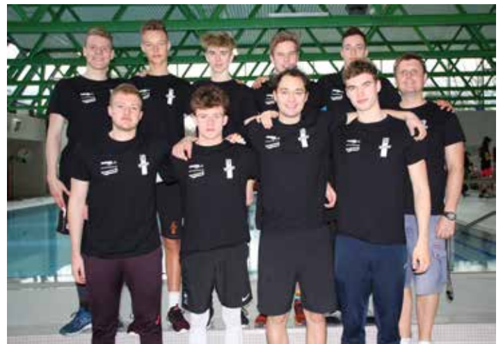
Das TV-Herrenteam I in der 2. Bundesliga Süd.