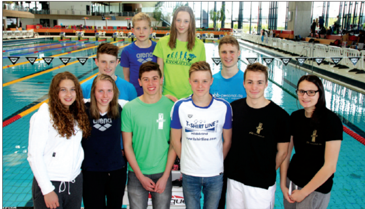
Das Wetzlarer Team in Luxemburg.