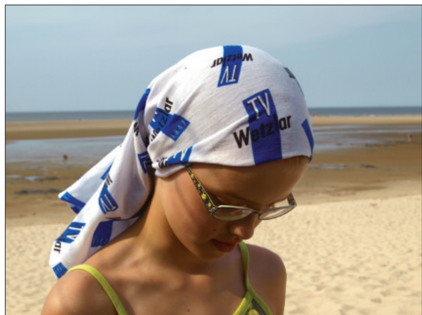
Der Turnverein Wetzlar ist auch Urlaub dabei.

❖ Die Sportler, Jugendlichen, Eltern, Übungsleiter und Helfer auffordern, Fotos zu machen und Erlebnisberichte zu schreiben