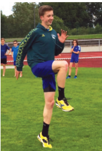
... und im Stadion.

„Ich komme aus der Leichtathletikabteilung des TV und bin so auf diese Tätigkeit aufmerksam geworden, und sie schien mir interessant“, betrachtet der 19-Jährige die-