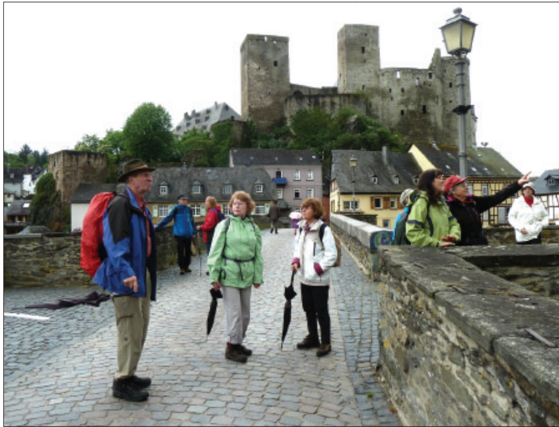
Vor historischem Gemäuer in Runkel.

Die Gruppe 2 folgte mehr dem Ansatz des Entspannungswandern, was insbesondere durch ein kleines Nickerchen während der Mittagspause zum Ausdruck kam. Erwartungsgemäß führte die Vortour mit