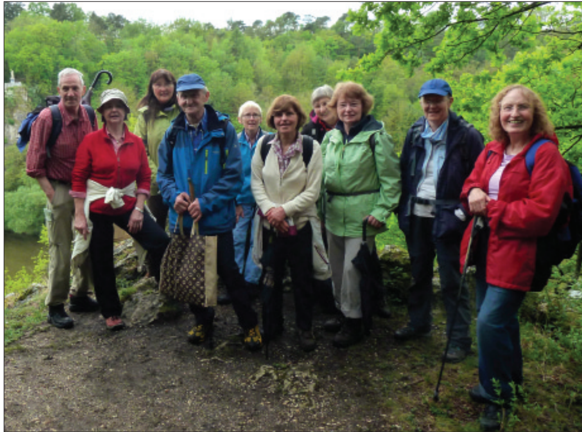
Die Wetzlarer Wanderer sind trotz Regen gut gelaunt in der Gegend um Runkel unterwegs.

Normalerweise geht man in unseren Breiten davon aus, dass im Februar die Farbe Weiß in der Natur dominiert und die Temperaturen unter dem Gefrierpunkt liegen. Unsere Monatswanderung im Februar hielt viele intensive Farbtupfer am Himmel und in der Landschaft für uns bereit. Auf unseren Wegen rund um Rechtenbach konnten wir die abwechslungsreiche Landschaft in vielen sonnigen Abschnitten genießen. Für die Gruppe 2 hatte Herbert H.G. Wolf alles in die Streckenführung eingepackt, was zu einer abwechslungsreichen Wanderung gehört: viel Wald und Feld, sowie schöne Panoramaausblicke. Besonders her-