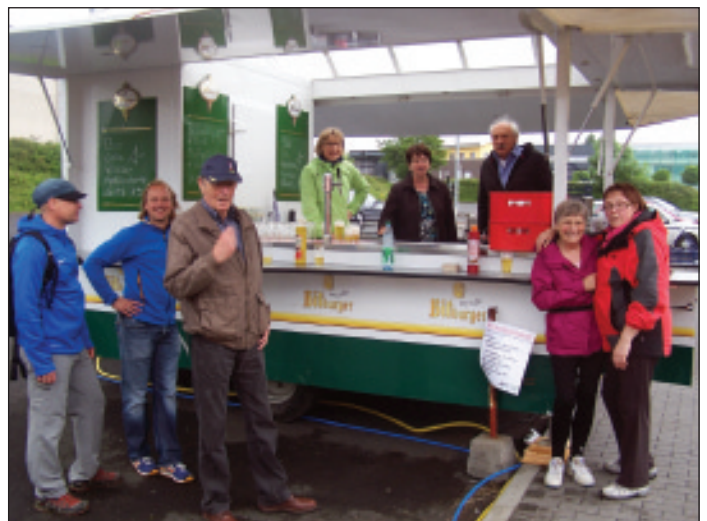
Am Imbisswagen herrschte gute Stimmung.