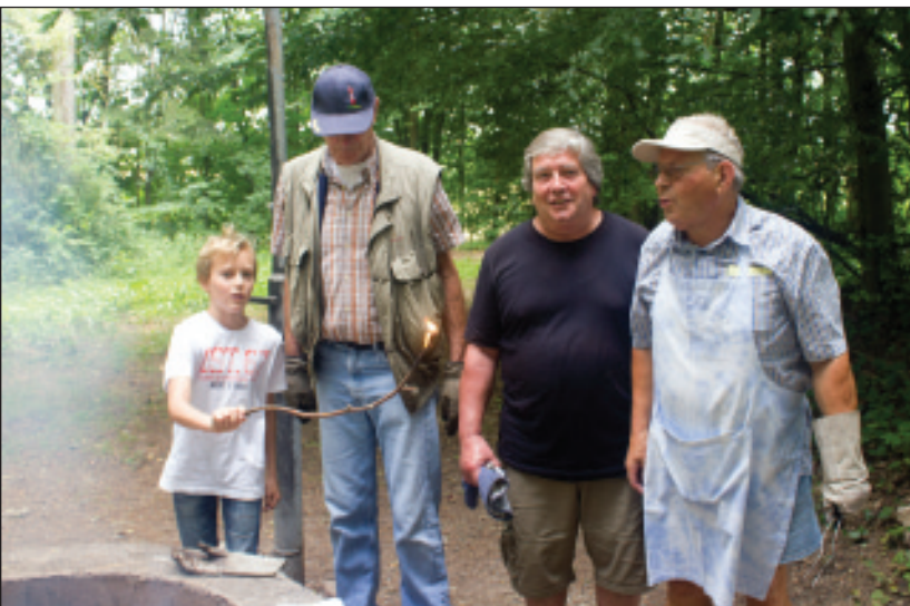
Die Wanderung mit anschließendem Grillen ist sehr beliebt.

Los ging's am Studio 2, unterhalb des Cube entlang in Richtung des neuen Baugebiets Rasselberg. Nach einer kurzen Inaugenscheinnahme der laufenden Erschließungsmaßnahmen führte die Tour entlang des neuen Friedhofs in Richtung Bismarkturm. Auf dem Deutschherrenberg bot sich die Gelegenheit, einen kurzen Blick auf ein Stück Industriegeschichte unserer Stadt zu werfen. Auf der „Reiteralm“ angekommen, wurde unter den Mitwanderern die Lage des Dünsberg und der Burg