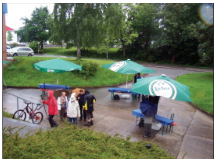
Tische und Bänke blieben leer.

Kosten: 10er Karte Mitglieder 20,- € 10er Karte Nichtmitglieder 60,- €