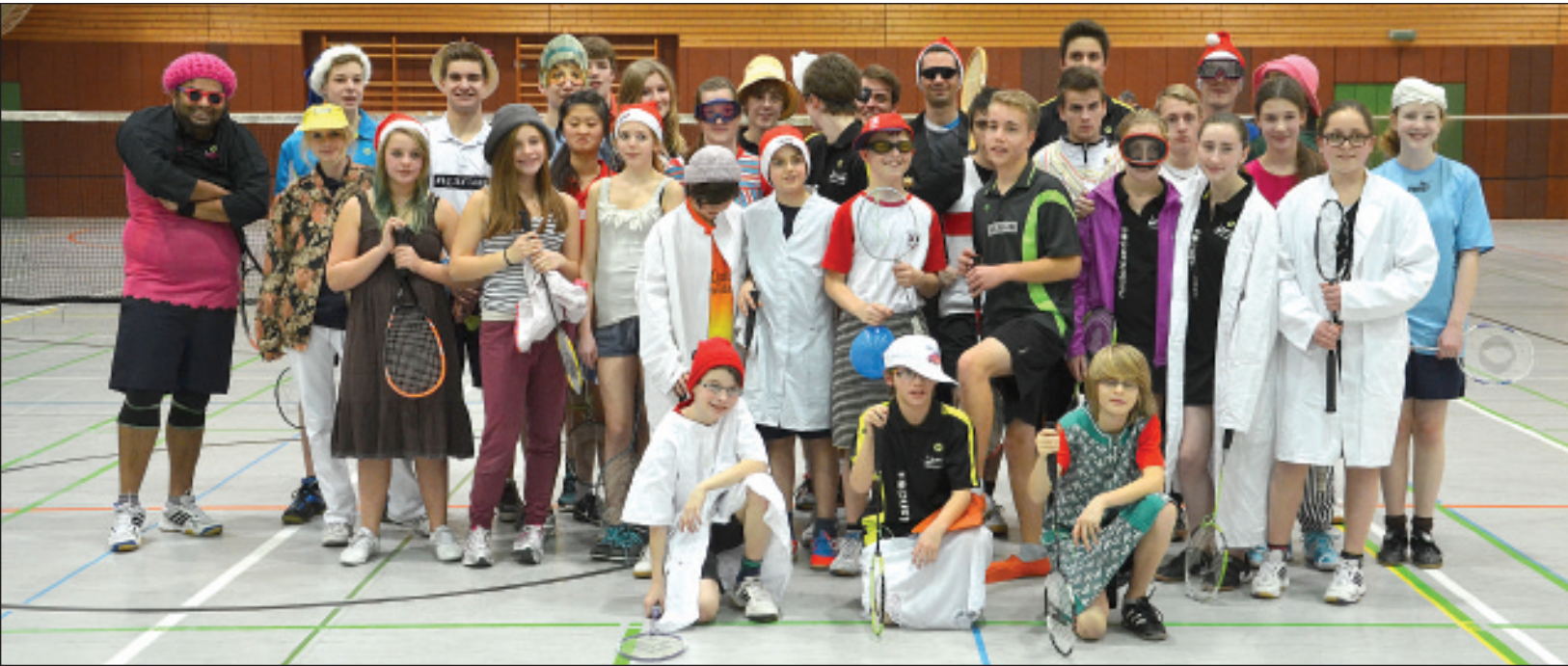
Beim Jux-Turnier der Badminton-Abteilung hatten alle wieder sehr viel Spaß.