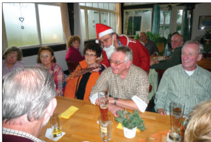
Sankt Nikolaus kommt mit himmlischen Gaben und biegsamer Weidenrute zu den fröhlichen Wanderern.