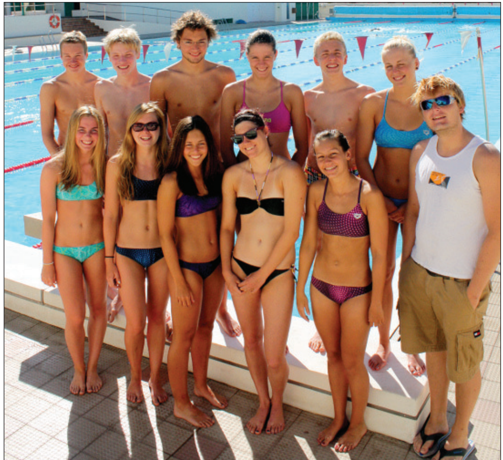
Das Wetzlarer Team auf Lanzarote.

Das 6. Frühjahrsmeeting des TV Wetzlar musste wiederum erneut im März im Westbad in Gießen ausgetragen werden. 24 Vereine mit