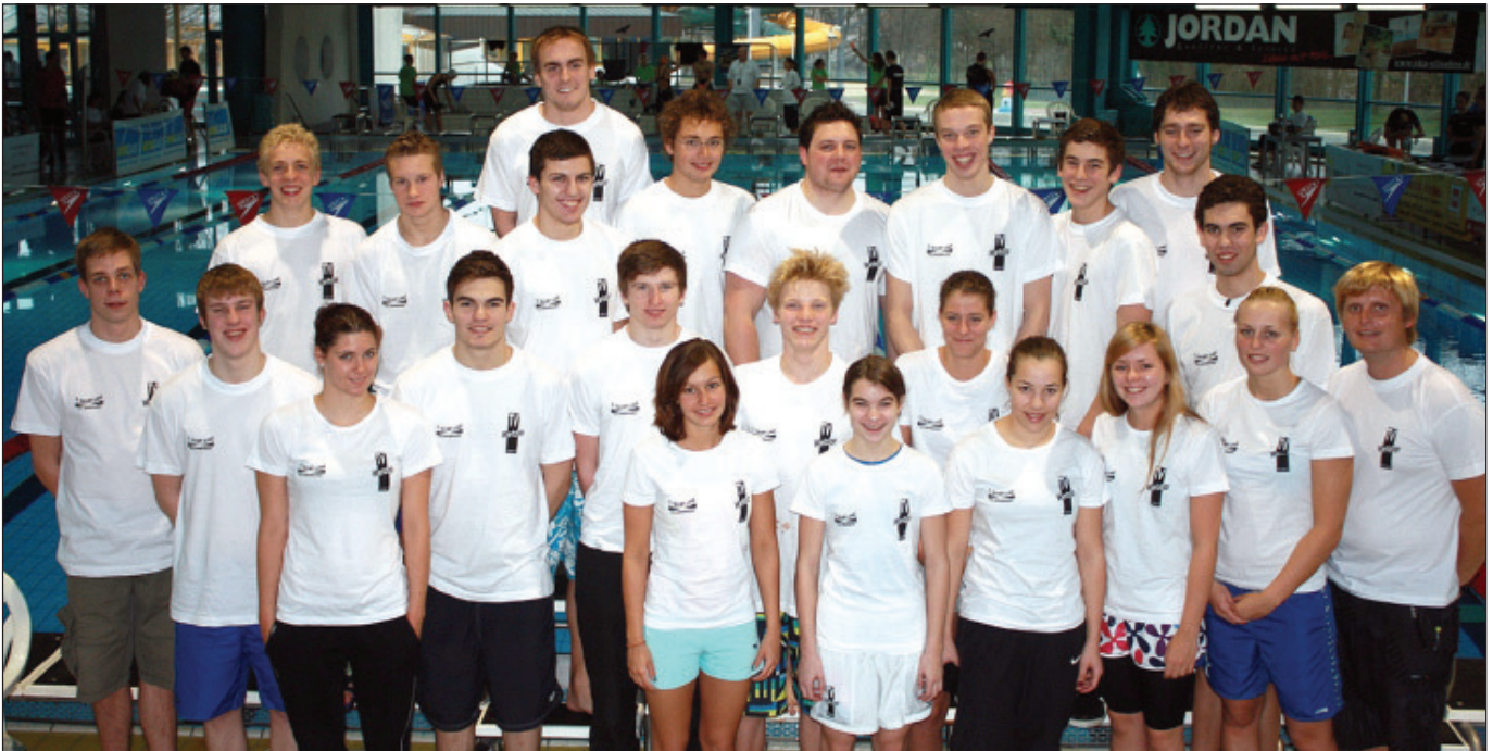
Das große Aufgebot des TV Wetzlar bei der Deutschen Mannschaftsmeisterschaft.