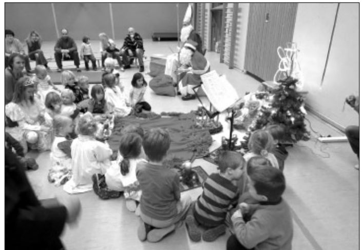
... bevor nur noch Kerzenlicht die Halle erhellt...