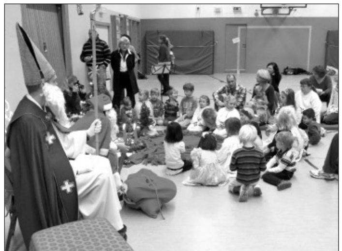
... und „Stille Nacht, heilige Nacht“ den Abschluss der Weihnachtsfeier bildet.