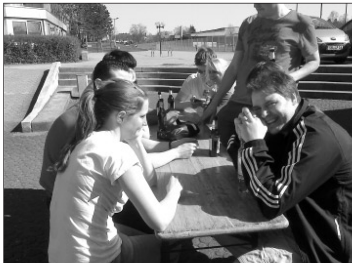
... den Tag bei Grillwürstchen und kalten Getränken ausklingen.

An alle Mitglieder, Übungsleiter und Delegierte