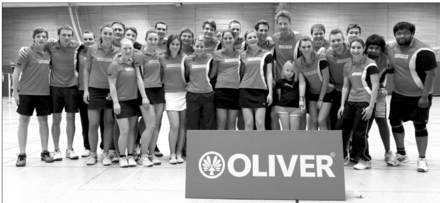
Die erfolgreichen Spieler und Spielerinnen des Badminton-Leistungszentrum Mittelhessen hatten allen Grund zur Freude.