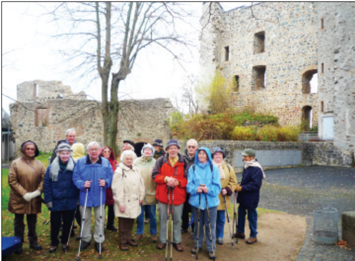
Die Wandergruppe des TV Wetzlar im Hof der Burg Hohensolms.