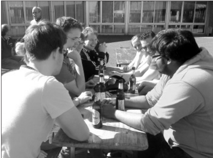
Nach den Wettkämpfen lassen die Sportler...