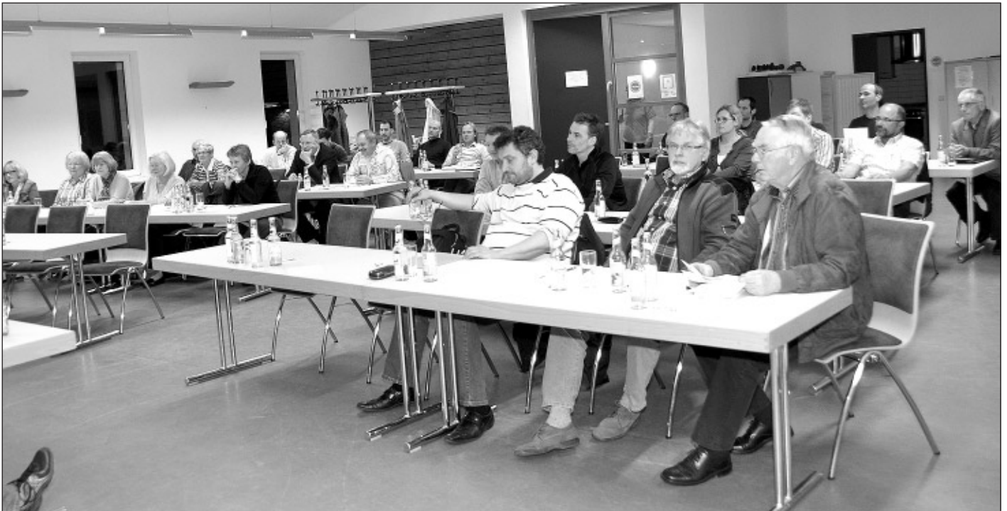
Die Delegiertenversammlung beschloss eine Erhöhung der Beiträge für Mitglieder und Kursteilnehmer.