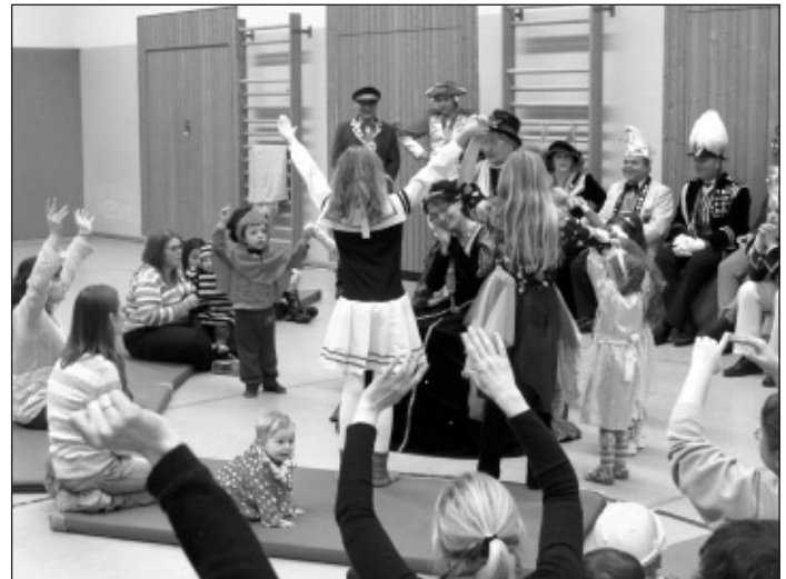
...„Same procedure as every year...“ mit dem Muss für jede Prinzessin: „Dornröschen, schlafe 100 Jahr“ nach dem Prinzenkuss mit viel Helau den spannenden Nachmittag beendet.