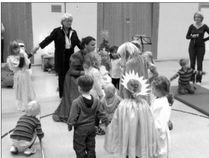
... das Theaterspielen als „Highlight“ für alle Kinder kommt...