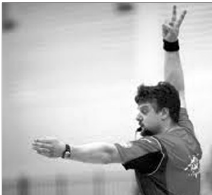
Der Schiedsrichter spricht Strafen aus und wird zum Buhmann.

Das Erste, was Nachwuchsschiedsrichter in Sporthallen zu hören und zu sehen bekommen, sind empörte Zuschauer, häufig Eltern, die – wenn es um ihren Nachwuchs geht – zu regelrechten Furien mutieren. Bekommen wir dadurch aber bessere