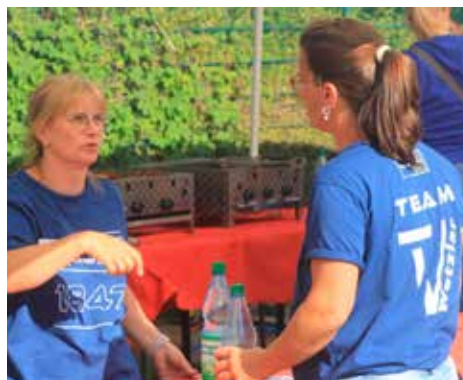
Aktive beim Catering (Wetzlar in Motion / 175 Jahre TVW)