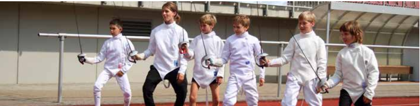
Training Wetzlar in Motion Schrittlübung