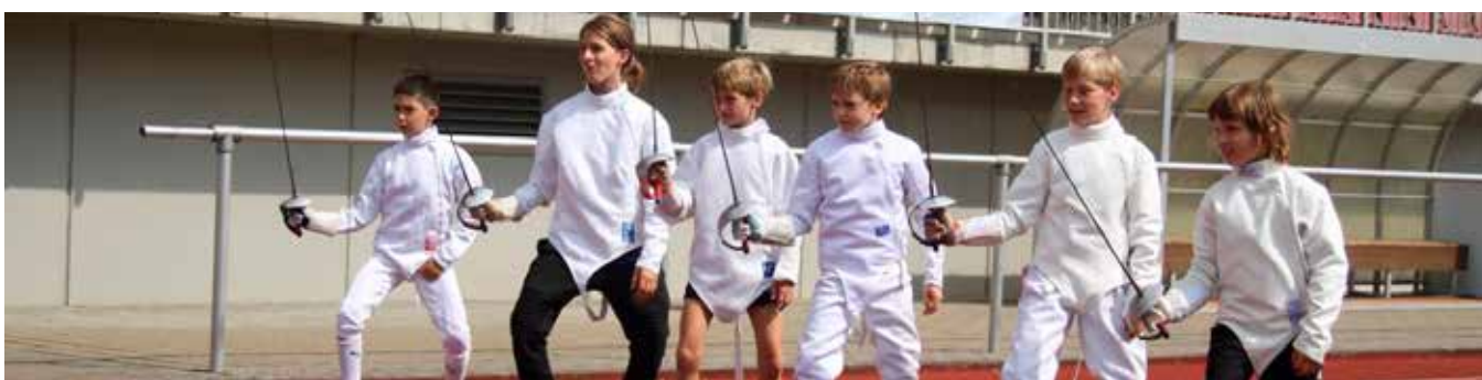
Training Wetzlar in Motion Schritttübung