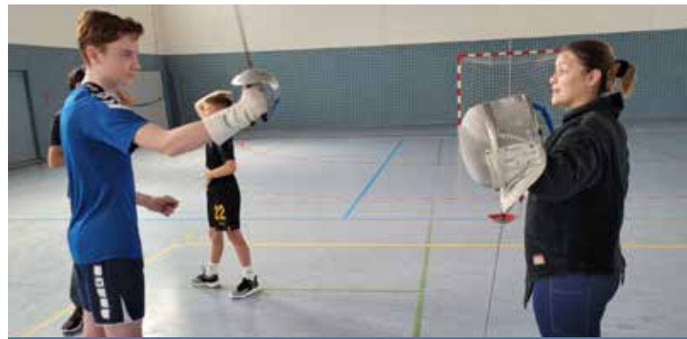
Hüttenerger Ferienspiele Erste Mensurübung