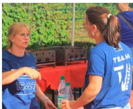
Aktive beim Catering (Wetzlar in Motion / 175 Jahre TVW)