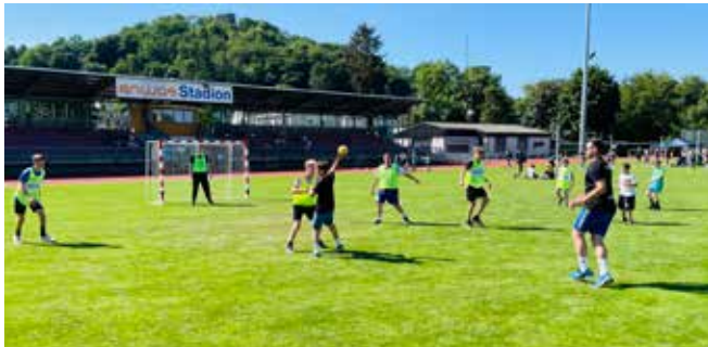
„Kein Durchkommen – Die DSW-Boys beißen sich im Angriff im wieder die Zähne aus. Am Ende reicht es für Platz 4.“

Während die Abteilung Leichtathletik zum Jubiläum einen Wettkampf ausrichtete, die Schwimmer mit einem riesigen Pool ins Stadion lockten und die Fechter ihre Elektromatten auf der Laufbahn ausrollten, richteten die Vereinshandballer ein Feld-Handballturnier der besonderen Art aus.