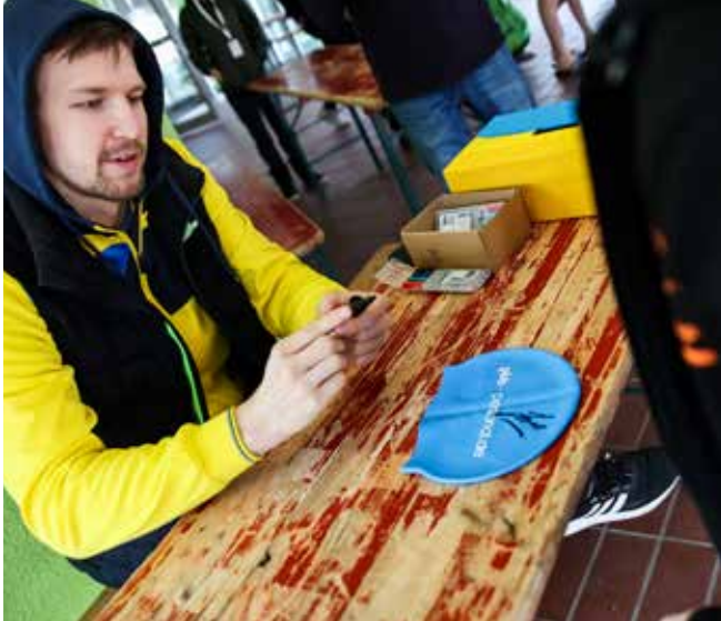
Weltrekordler Andrii Govorov aus der Ukraine beim Frühjahrsschwimmfest im März in Wetzlar