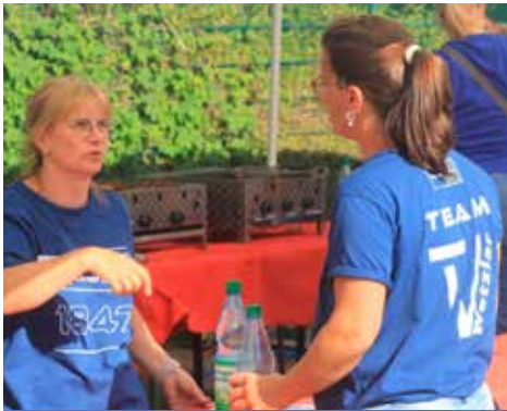
Aktive beim Catering (Wetzlar in Motion / 175 Jahre TVW)