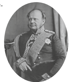
Friedrich Wilhelm IV. von Preußen

In seinem Gründungsjahr 1847 war es nicht selbstverständlich, einfach mal so auf der grünen Wiese Sport zu treiben. Wurde doch erst fünf Jahre zuvor, 1842, per Kabinettsorder durch den preußischen König Friedrich Wilhelm IV., die sogenannte Turnsperr aufgehoben. Leibesübungen gehörten von nun an zum anerkannten „Bestandteil der männlichen Erziehung“ – was der Turnbewegung um Gründungsvater Friedrich Ludwig Jahn in Deutschland zum Durchbruch verhalf. Im politischen Kontext durchlebte der TV Wetzlar nicht nur in seinen Gründungsjahren unruhige Zeiten.