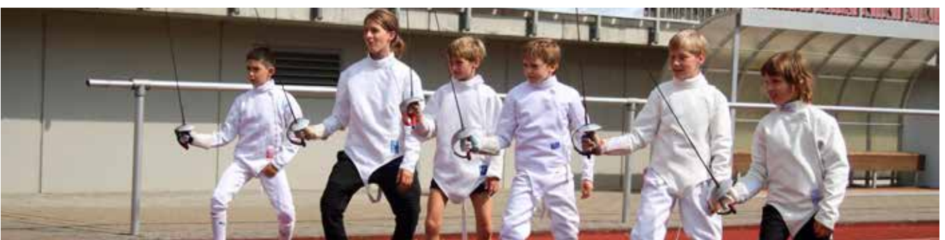
Training Wetzlar in Motion Schritttübung