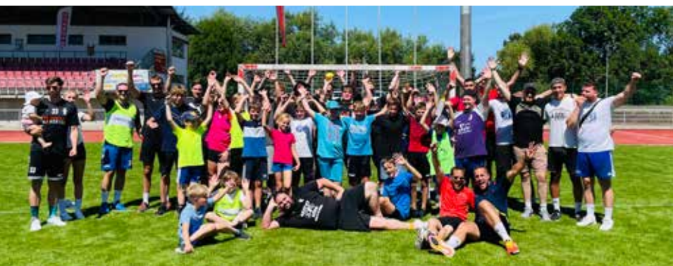
„Hatten allen Grund zum Jubeln – von Klein bis Groß freuen sich die Spielerinnen und Spieler, Organisatoren und Schiedsrichter über ein gelungenes Turnier“

Dabei durften sich die jeweiligen Teamkapitäne (allesamt Spielerinnen und Spieler der E-Jugend) nacheinander aus mehreren Spielerpools bedienen, die in Alterskategorien geklastert waren. So wurde gewährleistet, dass Groß und Klein im ausgeglichenen Verhältnis gegeneinander spielten. Insgesamt traten acht Teams gegeneinander an. Darunter die „Wetzlarer Vikings“, Team „Schnecke“, Team „Aurelia“ oder auch die „DSW-Boys“. Gespielt wurde in zwei Gruppen. Die jeweiligen Gruppensieger trafen im Halbfinale auf den zweiten der anderen Gruppe und spielten um die Finalteilnahme. Ein Spiel wurde über 2x 10 Minuten samt Seitenwechsel ausgetragen. Um sicherzustellen, dass jeder Spieler und jede Spielerin gleichwertig in das Spiel eingebunden wurde, wurden die geworfenen Tore mit der Anzahl der Torschützen multipliziert.