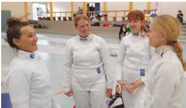
Manöverkritik der Degen Damen des TV Wetzlar.