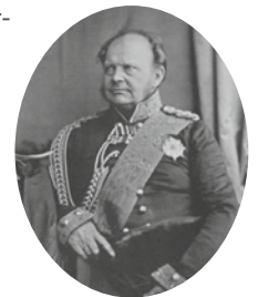
Friedrich Wilhelm IV. von Preußen

In seinem Gründungsjahr 1847 war es nicht selbstverständlich, einfach mal so auf der grünen Wiese Sport zu treiben. Wurde doch erst fünf Jahre zuvor, 1842, per Kabinettsorder durch den preußischen König Friedrich Wilhelm IV., die sogenannte Turnsperr aufgehoben. Leibesübungen gehörten von nun an zum anerkannten „Bestandteil der männlichen Erziehung“ – was der Turnbewegung um Gründungsvater Friedrich Ludwig Jahn in Deutschland zum Durchbruch verhalf. Im politischen Kontext durchlebte der TV Wetzlar nicht nur in seinen Gründungsjahren unruhige Zeiten.