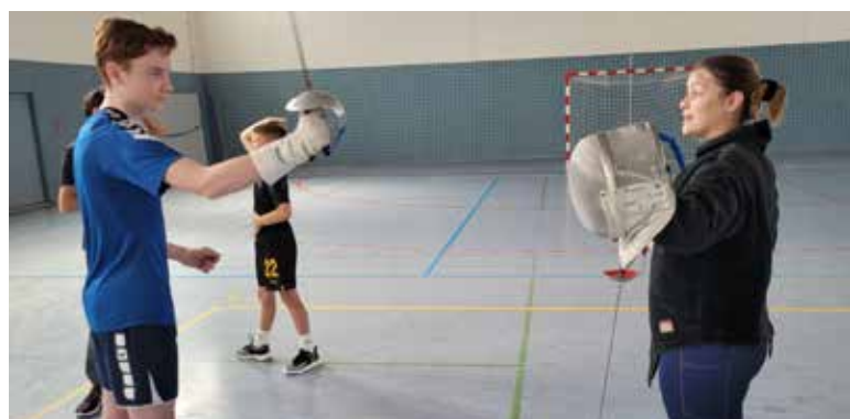
Hüttenerger Ferienspiele Erste Mensurübung