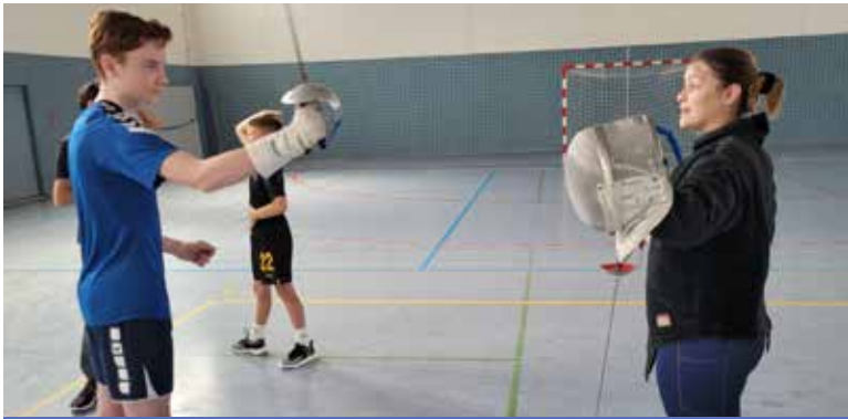
Hüttenerger Ferienspiele Erste Mensurübung