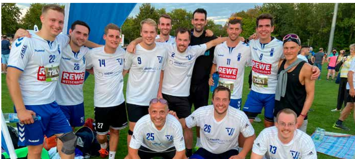
„Da fehlt doch die Hälfte – Für ein gemeinsames Gruppenbild versammeln sich die Laufteilnehmer der Handballabteilung nach dem absolvierten Brückenlauf auf dem Stadionrasen“

Rundum eine gelungene Veranstaltung, die auch im nächsten Jahr eine blau/weiße Färbung durch die Handballsportler erfahren wird.