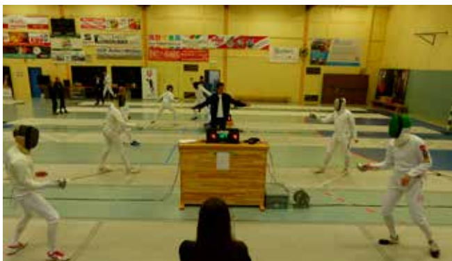
Vorrunde Aktive Herren Degen