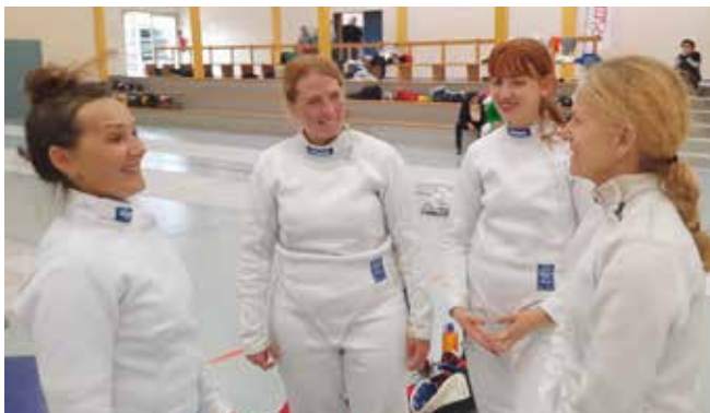
Manöverkritik der Degen Damen des TV Wetzlar.