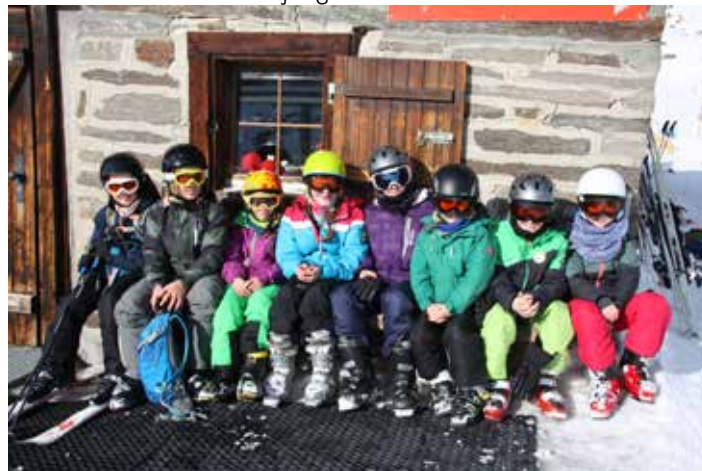
Die Gruppe der Anfänger

Nach den täglichen Abfahrten ging es am frühen Nachmittag immer ins 25m Hallenbad in Saas-Fee. Auf zwei bis vier Bahnen konnte nach dem Skifahren das Wasser im für uns bekannten Aggregatzustand benutzt werden. Aber auch die Riesenrutsche und der Whirlpool im Schwimmbad wurden von uns rege genutzt. Nach sieben herrlichen Tagen und ohne Verletzungen ging es dann wieder nach Hause! Aber einig waren sich alle – das Wintertrainingslager wird wiederholt!