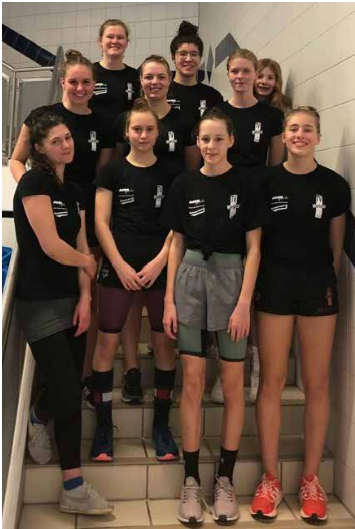
Das Wetzlarer Damenteam I in der Oberliga.

programms in Brust, Rücken, Schmetterling, Freistil und Lagen von 50 m bis 1500 m absolviert, jede Strecke muss dabei zweimal geschwommen werden. Jeder Sportler darf maximal fünfmal zum Einsatz kommen, aber keine/r eine Strecke doppelt schwimmen. Die erreichten Zeiten über die insgesamt 34 Strecken werden bei der DMS in Punkte umgerechnet, wobei der Weltrekord mit 1000 Punkten als Grundlage dient und zum Gesamtergebnis addiert. 2. Bundesliga Süd: Nachdem im Sommer einige Leistungsträger den Verein verlassen hatten, war hier der Klassenerhalt das große Ziel. Als Aufsteiger gingen die Männer erstmals in Freiburg in der zweiten Liga an den Start. Mit insgesamt sieben neuen Bezirksrekor-