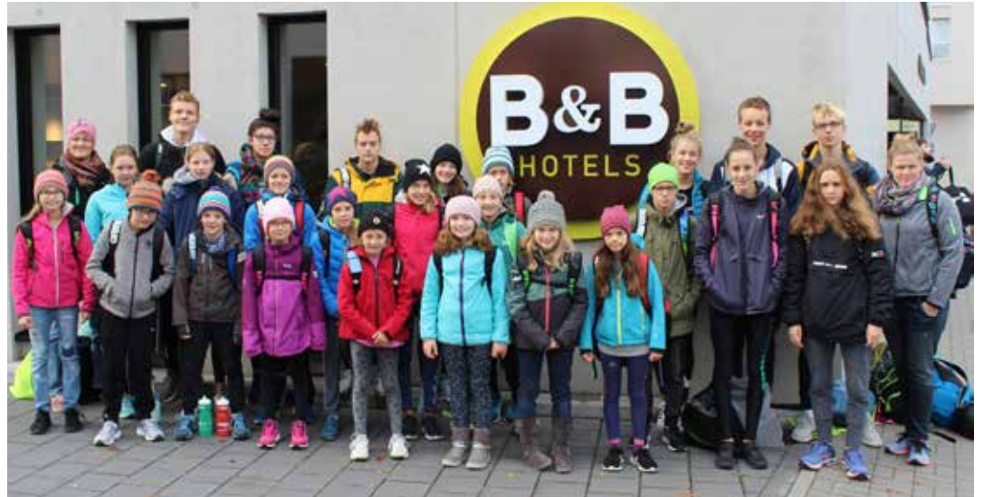
Gruppenbild aus dem Trainingslager.

hov haben sich in der Woche besonders angestrengt, sodass sie von den Trainern zu allen Strecken angemeldet wurden. Mit vielen Podiumsplätzen und Bestzeiten verließ das Team nach einer Woche Trainingslager die Schwimmhalle.