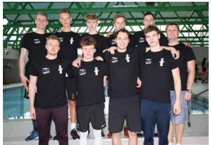
Das TV-Herrenteam I in der 2. Bundesliga Süd.