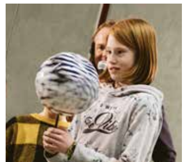
Auch der TV Wetzlar Nachwuchs versuchte sich an der Ball-Akrobatik