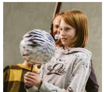
Auch der TV Wetzlar Nachwuchs versuchte sich an der Ball-Akrobatik