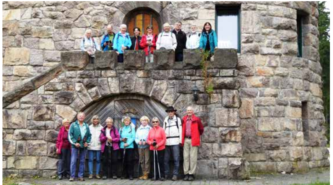
Die Mitglieder des TV Wetzlar und des Thüringer Wandervereins auf der HohenWarte.

Bei sonnigem Wetter wanderten wir am nächsten Morgen unter sachkundiger Führung auf Goethes Spuren zum Gipfel des 861m hohen Hausberges „Kickelhahn“. Auf dem sehr anspruchsvol-