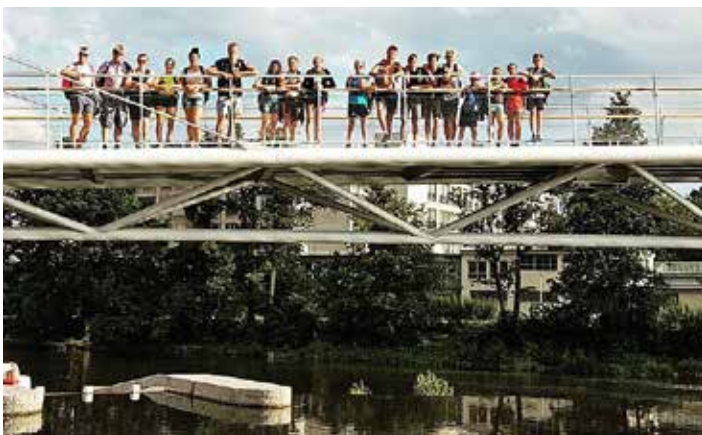
Wetzlarer in Pisek.

gen, war dagegen schon eher eine Herausforderung, die dennoch gemeinschaftlich gelöst wurde. Der Trampolinpark in Linden war am Mittwoch das Ziel, diverse Salti und Sprünge sowie der Ninja Warrior Parcours wurden von allen Teilnehmern souverän gemeistert.