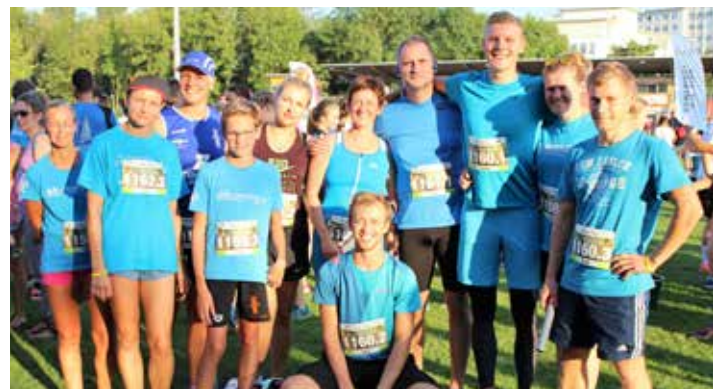
...der Erwachsenen.