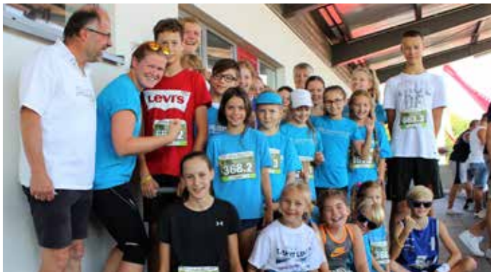
Teilnehmer beim Brückenlauf der Kids...