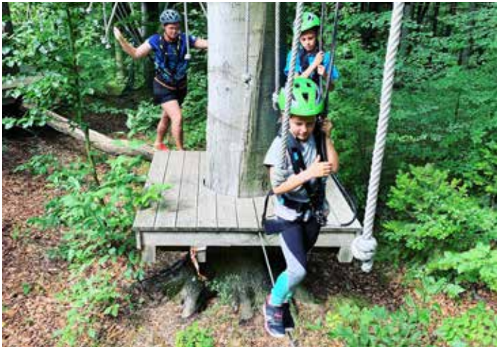
TV Wetzlar beim Klettern.

ningslagers in den Sommerferien war der Besuch des Aqua-Parks am Niederweimarer See in Marburg. Manche der Teilnehmer kämpften sprichwörtlich bis aufs Blut, wer als erstes den Park und die Rutschen besetzen durfte. Am Ende des Tages und des Auftaktes waren aber alle Teilnehmer guter Laune und motiviert für die neue Saison. Ein sehr gelungener Auftakt mit bereits guten Trainingsleistungen, die für die Zukunft hoffen lassen!