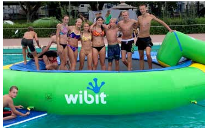
Spiel und Spaß beim Swim-In.