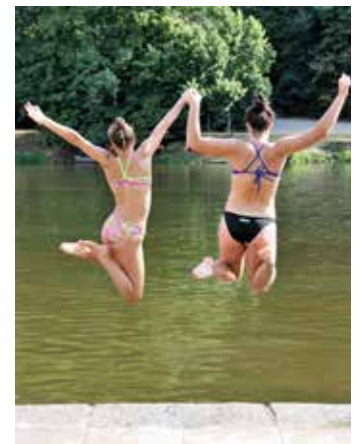
Sprung ins Flussbad der Ottawa in Pisek.