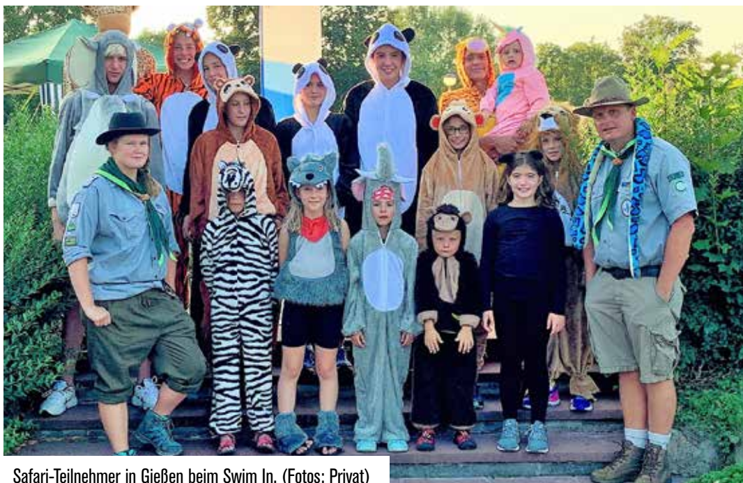
Safari-Teilnehmer in Gießen beim Swim In.

Textanlieferungen für die nächste Ausgabe bitte bis zum 15. Februar 2020