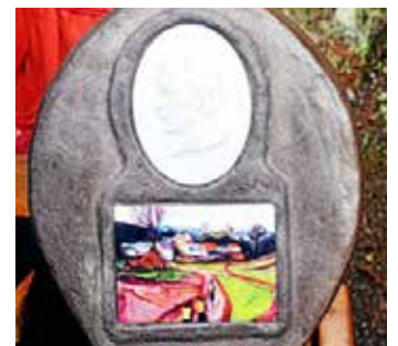
Denkmal an Edvard Munch

Auf einem gut ausgeschilderten ca. 14 km langen Wanderweg ging es zum Gipfel „Hohe Warte“. Nach einem Imbiss im gleichnamigen Waldgasthaus führte uns der Weg nach Ilmenau. Bei einem gemeinsamen Abendessen bedankten sich die Teilnehmer bei den be-