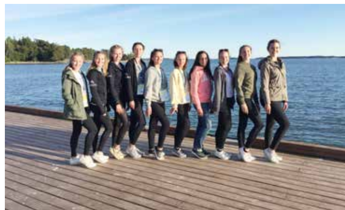
Die Dance Company bei einem Ausflug an die Ostsee.