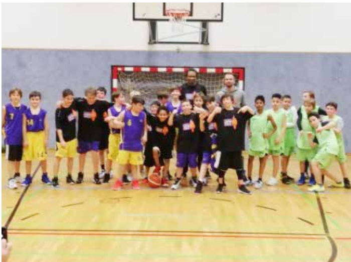
Mist! Mit 50:51 knapp verloren.