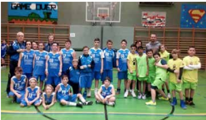
Beim ersten Spiel waren wir so aufgeregt!