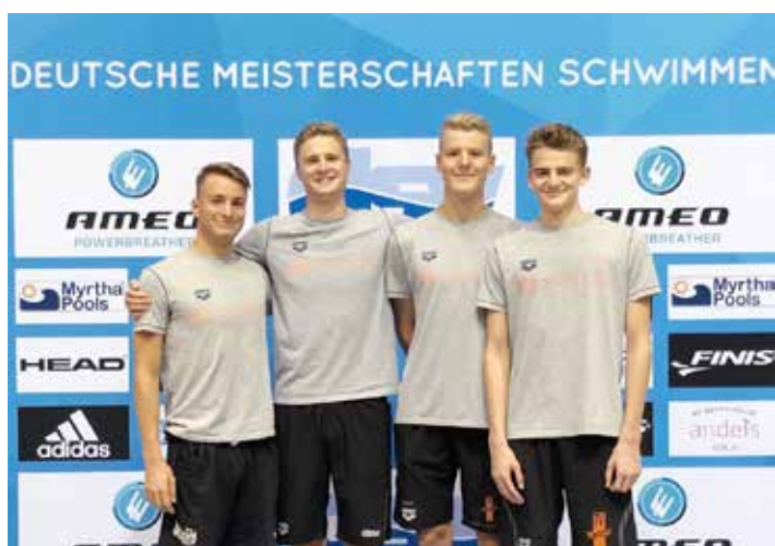
Der Schwimmkader des TV Wetzlar

in der Umgebung konnte nur Trainingszeiten ab 20 Uhr anbieten. Das Freibad im Badezentrum Ringallee in Gießen hat uns Schwimmer aber dankenswerterweise aufgenommen. Neu waren in diesem Jahr zwei abgetrennte Bahnen für sportliche Schwimmer, sodass der Wellengang einigermaßen erträglich war. Dennoch waren diese beiden Bahnen eigentlich für den offenen Ba-