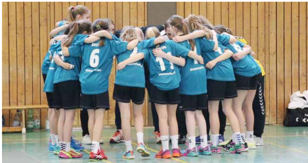
Die Auswahlmannschaft schwört sich auf die Partie ein.

Die Handballabteilung des TV Wetzlar hatte sich für die Ausrichtung des Turnieres beworben und hatte den Zuschlag