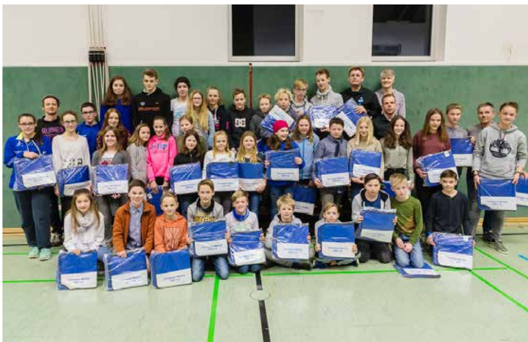
Auch die geehrten Schüler und ihre Trainer bekamen ein Präsent des TV für ihre besonderen Leistungen im letzten Jahr.