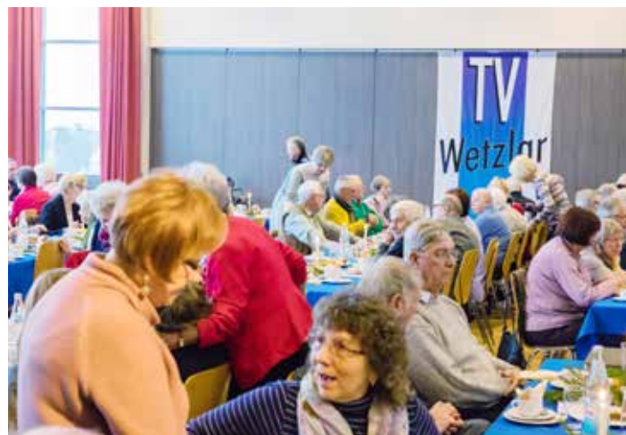
In der Kaffeepause gab es viel zu erzählen.