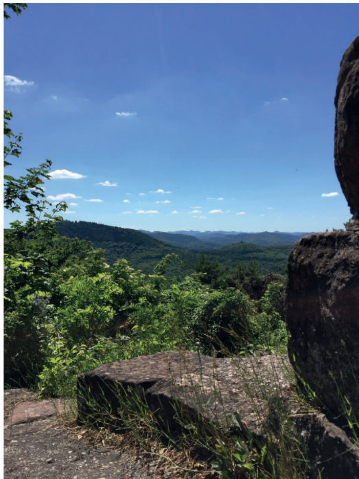
Panoramablick über den Pfälzerwald bei Kaiserwetter