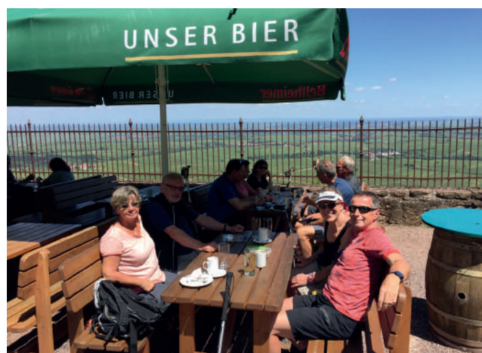
Einkehr auf der Madenburg

Wir verbrachten sehr lustige Stunden mit anregenden Gesprächen und werden sicher auch im nächsten Jahr zum mittlerweile vierten Ausflug dieser Art zusammenkommen.