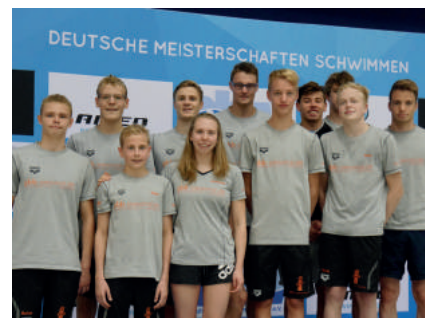
Deutsche Meisterschaften im Schwimmen Juni 2017