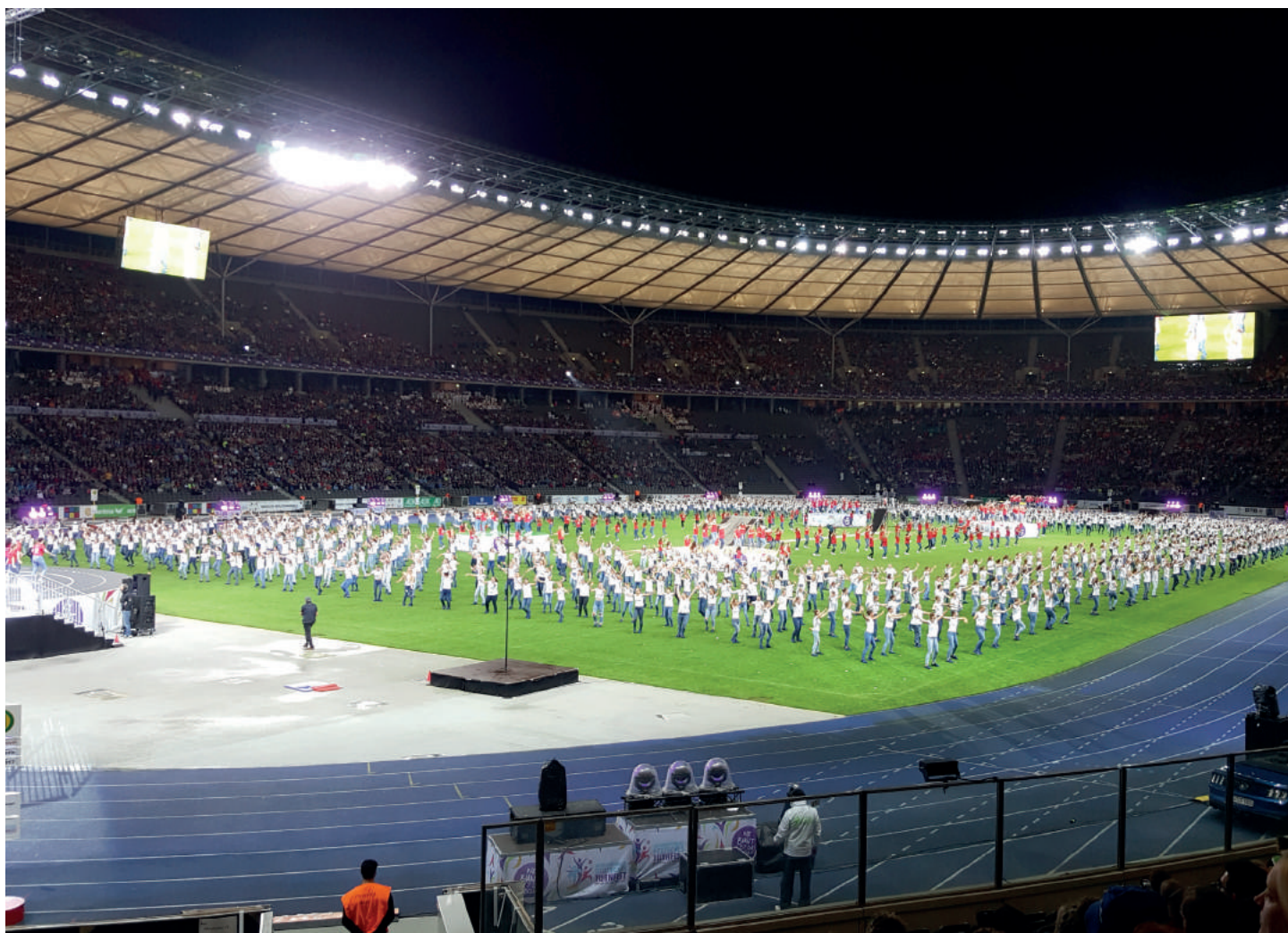
TVW-Tänzerinnen „Lumière“ waren am Dance-Bild beteiligt

Während eines riesigen Feuerwerks am Ende konnte man sich die Worte unserer Bundeskanzlerin vergegenwärtigen: „Berlin ist seit Tagen im Turnfestfieber. Bei echtem Fieber hofft man, dass es schnell vorbei ist. Doch wenn einen das Turnfestfieber packt, kann es nicht lange genug gehen.“ Bis zum nächsten Mal 2021 in Leipzig!