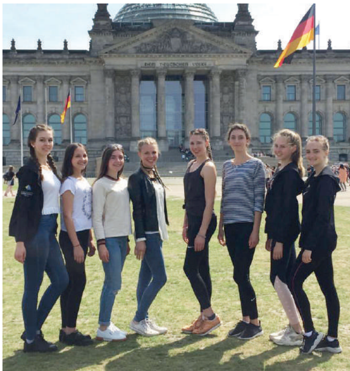
Die Wettkampfgruppe vor dem Reichstag

vier Zehntel mehr sogar einen siebten Platz hätten erreichen können. Zwei erste Plätze gingen an den hessischen Verein TV Dieburg (Hessen) und TSV Firnhaberau (Bayern). Bei 18+ siegte ebenfalls ein hessisches Team der SG Ueberau.