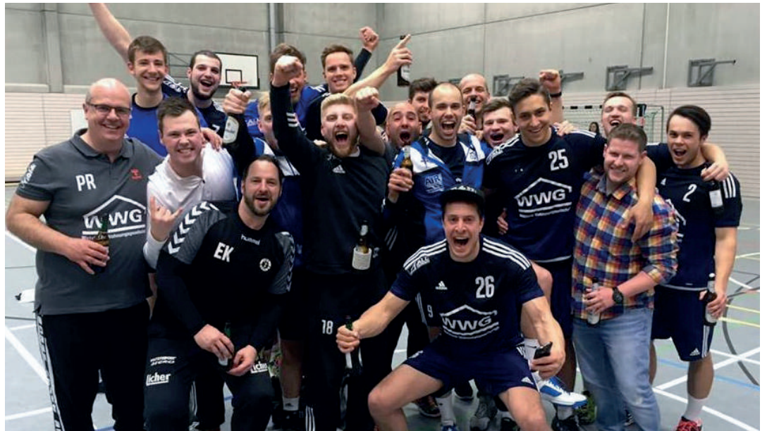
Klassenerhalt nach dem Spiel in Södel unter Dach und Fach - Die Mannschaft posiert zum Siegerfoto

Doch bereits das erste Saisonspiel bei den Turn- und Sportfreunden in Heuchelheim, bei dem wir unsere Giftigkeit unter Beweis stellten, das Spiel jedoch knapp verloren, ließ erahnen, dass wir kein Punktelieferant für die Konkurrenz sein würden. Punktgewinne in eigener Halle gegen Mörlen, Dilltal und Grünberg folgten, und dennoch war uns allen bewusst, dass wir noch ordentlich punkten müssen, um die Konkurrenz auf den Abstiegsrängen möglichst lange auf Abstand zu halten. Frust-