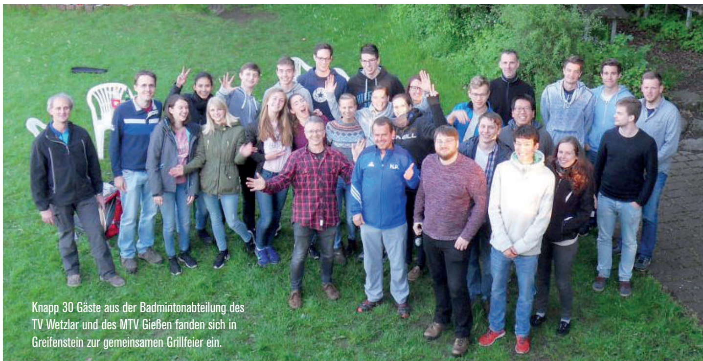
Knapp 30 Gäste aus der Badmintonabteilung des TV Wetzlar und des MTV Gießen fanden sich in Greifenstein zur gemeinsamen Grillfeier ein.