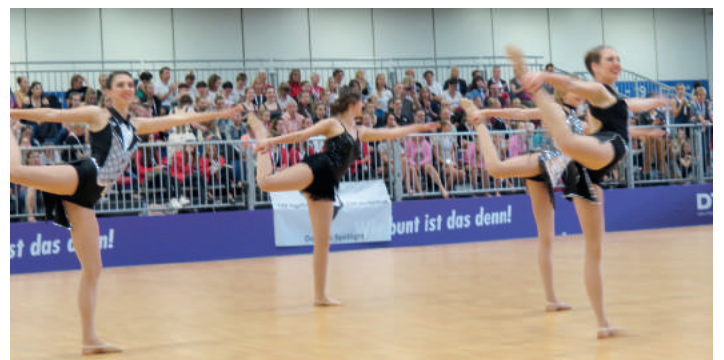
Dance-Cup DTB-Dance Team Lumière