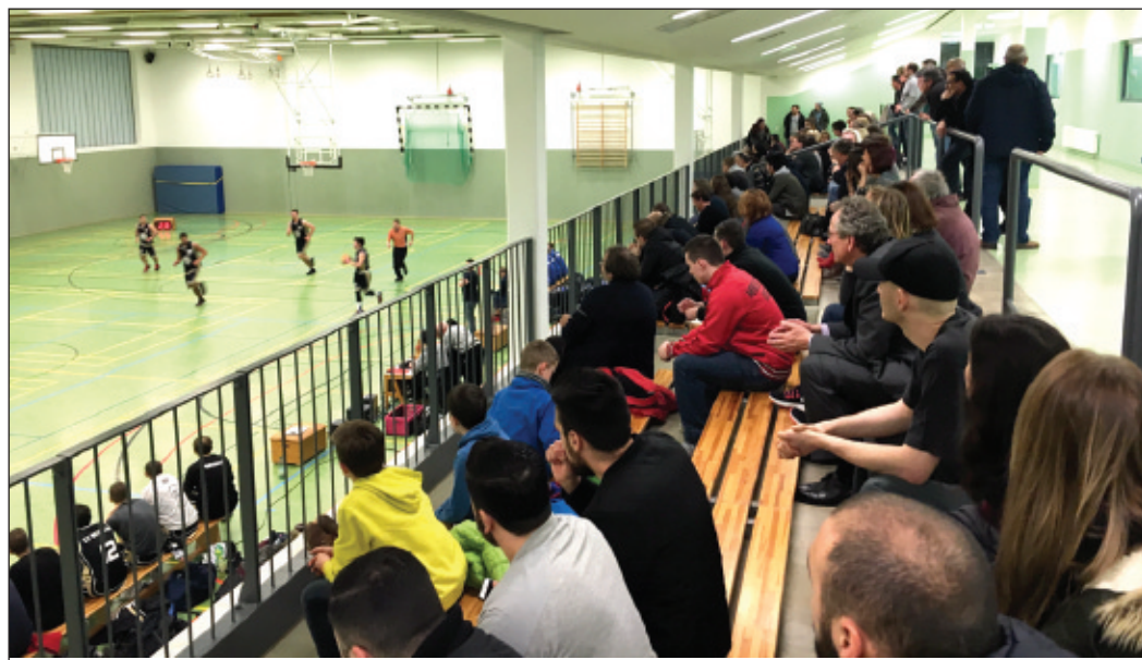
Gut besetzte Halle der Pestalozzischule beim Spitzenspiel gegen den TSV Langgöns.