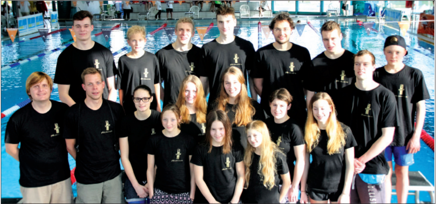
Das Team des TV Wetzlar bei der Landesliga in Baunatal.