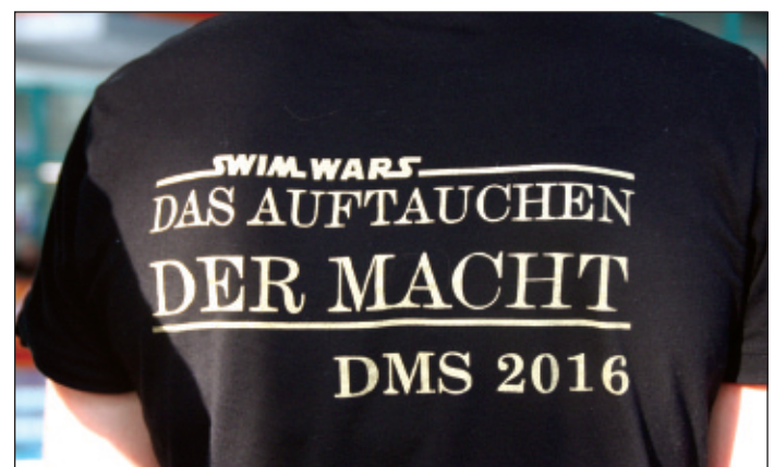
Das DMS-Shirt mit dem Motto für das Wochenende.

ermittelt. Zehn TV-Sportler/innen hatten im Vorfeld die Qualifikationsnormen unterboten und präsentierten die Vereinsfarben sehr erfolgreich. Mit einem neuen Bezirksrekord