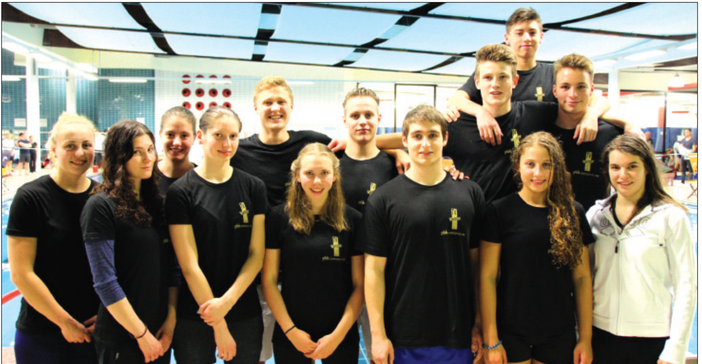
Die Wetzlarer Mannschaft bei der Oberliga in Gelnhausen.

Lagen von 50 m bis 1500 m absolviert, jede Strecke muss dabei zweimal geschwommen werden. Jeder Sportler darf maximal viermal zum Einsatz kommen, aber keine/r eine Strecke doppelt schwimmen. Die Aufstellung hat also auch viel mit Taktik zu tun, weshalb die Trainer bis zuletzt immer wieder an der optimalen Aufstellung feilen und hoffen, dass kein Sportler kurzfristig ausfällt. Bei den Mannschaftsmeisterschaften geht es also ganz klar