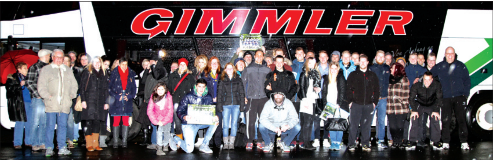
Aufstellung zum Erinnerungsfoto: Schlechtes Wetter, aber gute Laune.