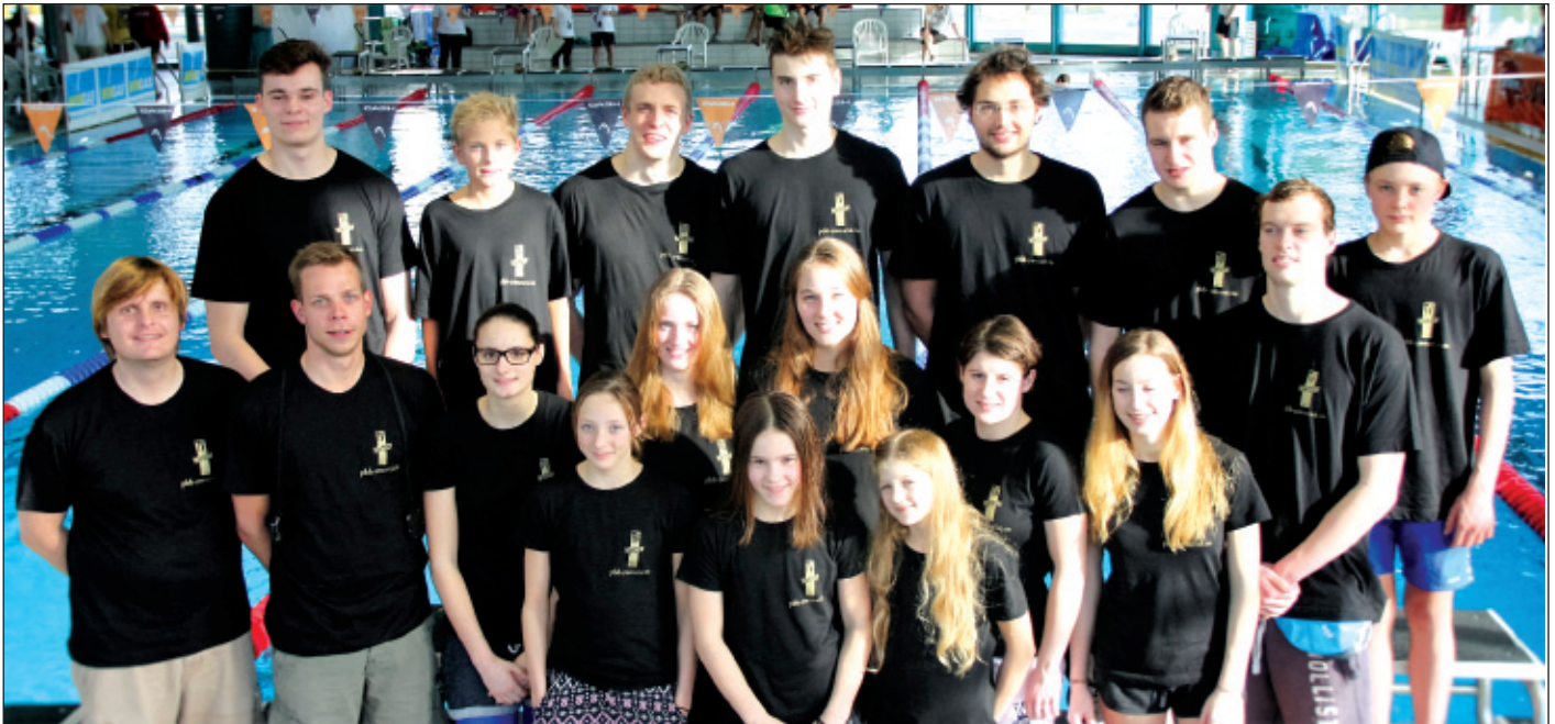
Das Team des TV Wetzlar bei der Landesliga in Baunatal.