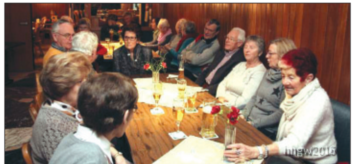
Die Abteilungssitzung und Feier waren gut besucht.

seine Entscheidung aufgenommen, zukünftig Karte und Kompass an den berühmten Nagel zu hängen. In po-