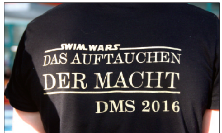
Das DMS-Shirt mit dem Motto für das Wochenende.

ermittelt. Zehn TV-Sportler/innen hatten im Vorfeld die Qualifikationsnormen unterboten und präsentierten die Vereinsfarben sehr erfolgreich. Mit einem neuen Bezirksrekord