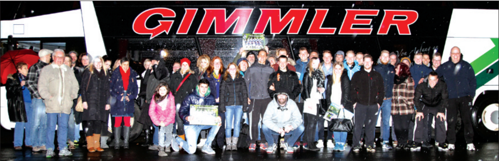
Aufstellung zum Erinnerungsfoto: Schlechtes Wetter, aber gute Laune.