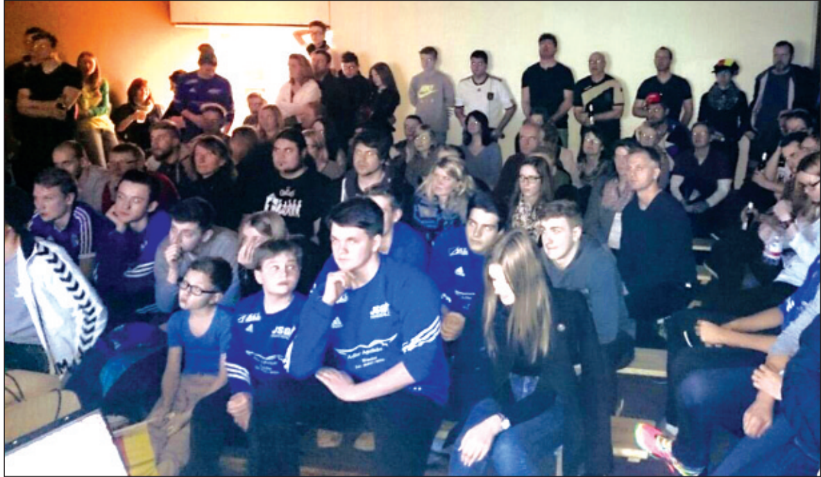
Ungläubiges Staunen bei Spieler und Fans im Foyer der Sporthalle der Eichendorffschule: Deutschland besiegt Spanien 24:17.

Es wären aber auch nicht die Handballer, wenn sie nicht in der Lage wären, aus der Not eine Tugend zu machen. Kurzerhand wurde der Termin neu organisiert und strukturiert. Dank sozialer Medien und dem guten alten Telefon wurde der Be-