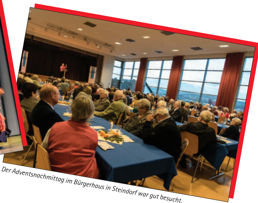
Der Adventsnachmittag im Bürgerhaus in Steindorf war gut besucht.