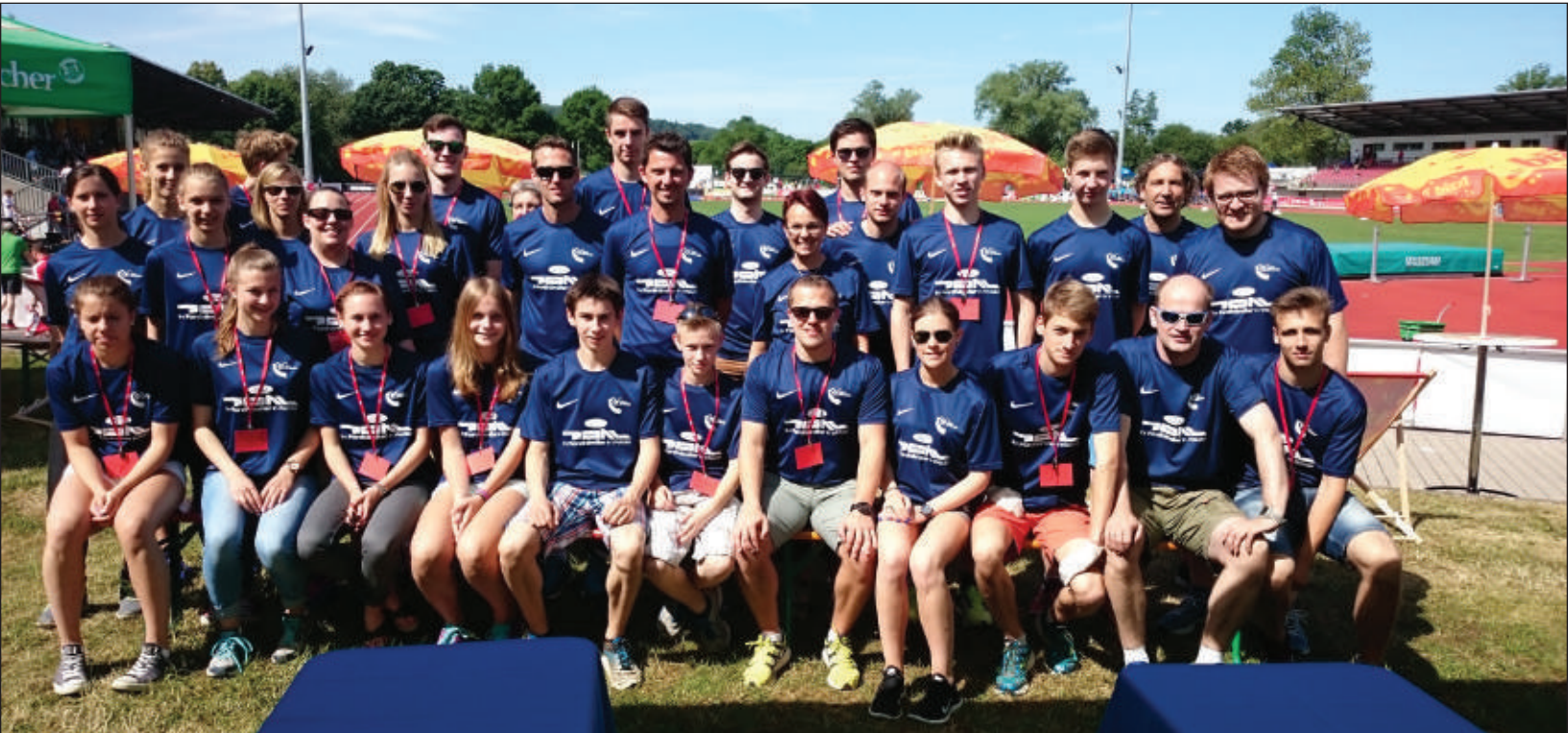
Das Helfer-Team des TV Wetzlar bei der U23-DM.