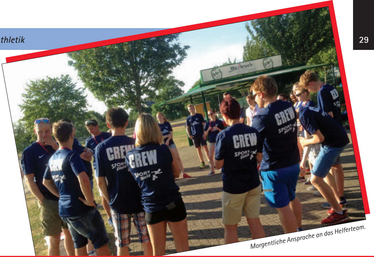
Morgentliche Ansprache an das Helferteam.