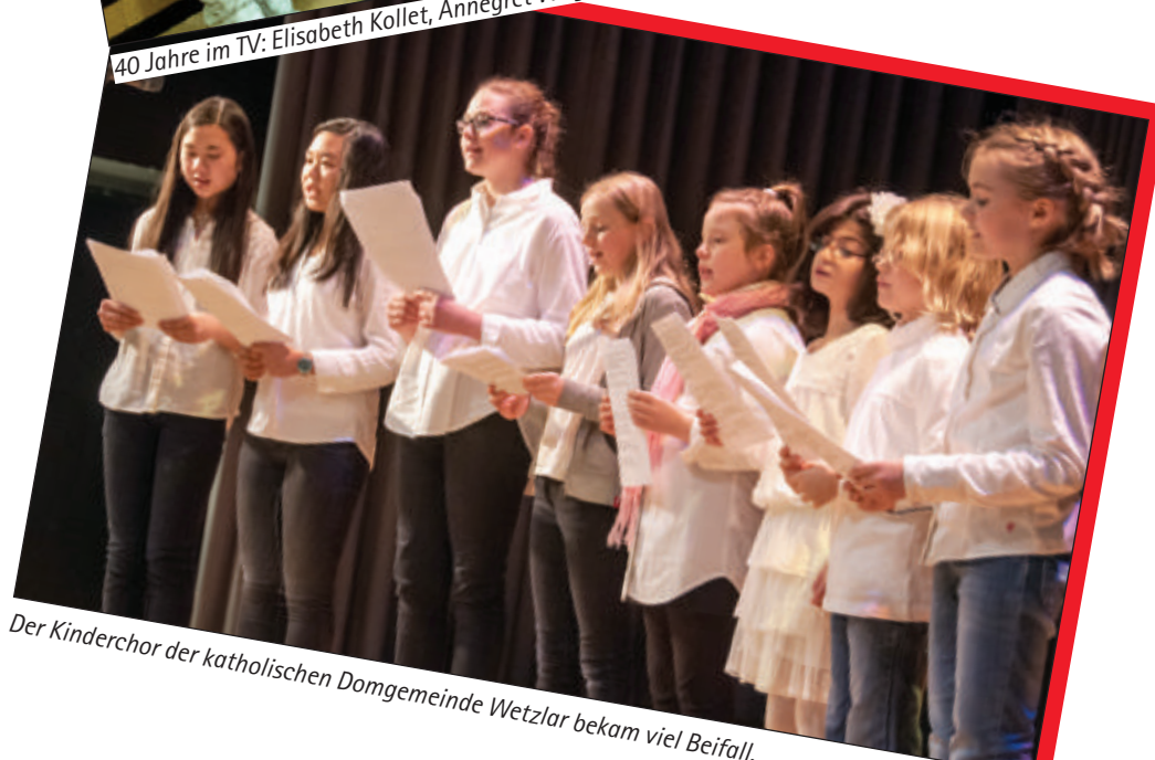
Der Kinderchor der katholischen Domgemeinde Wetzlar bekam viel Beifall.