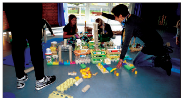
Gebaut wurde mit allen möglichen Materialien.