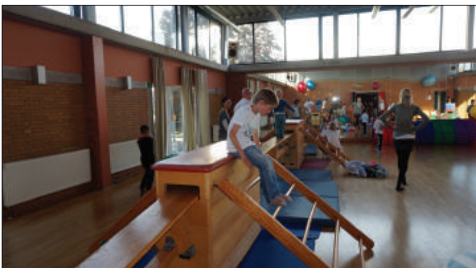
Beim Klettern war Geschick angesagt.