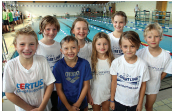
Die Jugend E des TV Wetzlar freut sich über die Bezirksmeisterschaft.