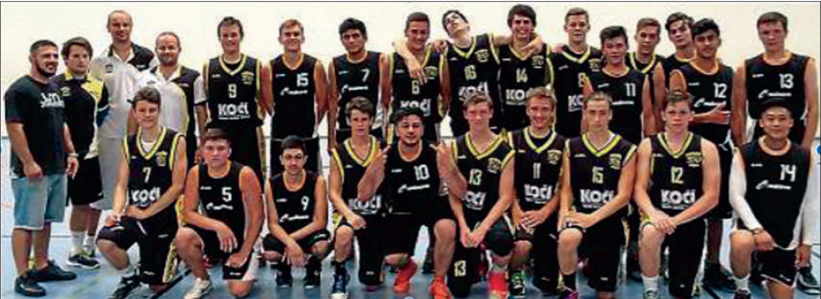
Die U18 des TV Wetzlar und das Team aus Pisek.