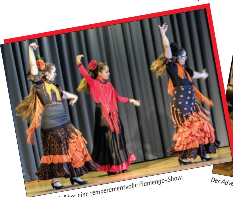
„Viva Espania“ bot eine temperamentvolle Flamenco-Show.